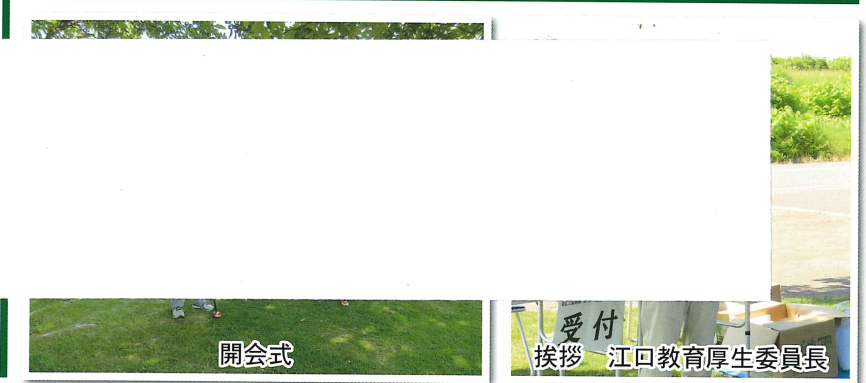
受付 挨拶 江口教育厚生委員長