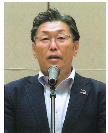
挨拶 西藤副理事長