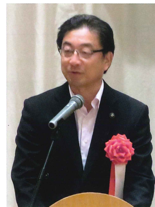
来賓挨拶 米沢帯広市長